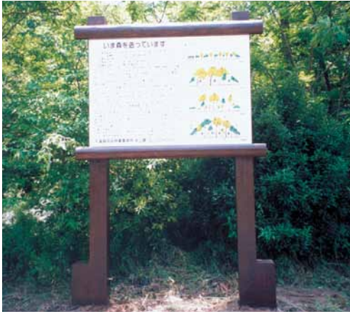
A-48 案内看板 H2670×L1740 杉・防腐塗着色料塗布 表示板アルミ複合板 (袖ヶ浦自動車検査登録事務所・袖ヶ浦市)