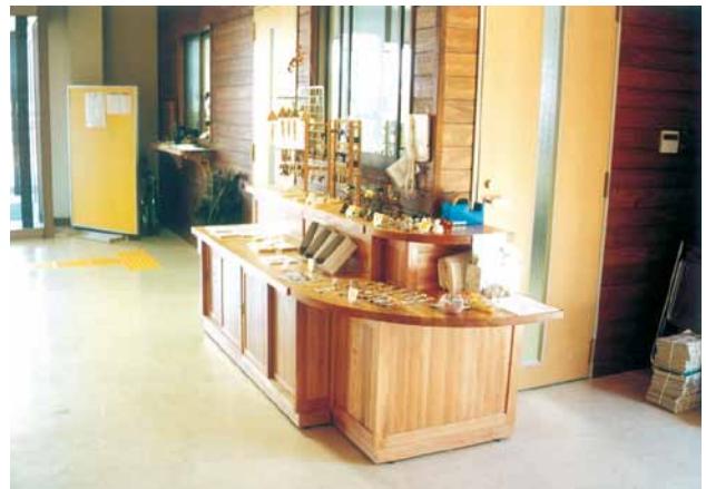
B-11 販売カウンター L2400×W900×H900 マテバシイ・ウレタンニス塗布 (野鳥の森・館山市)