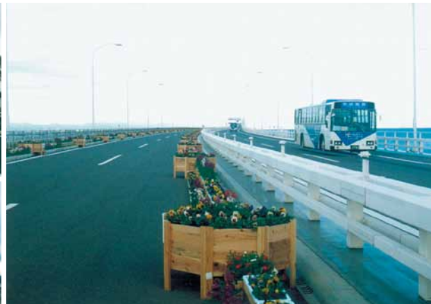
A-65 ウッドプランター (アクアライン完成記念イベント・木更津市)