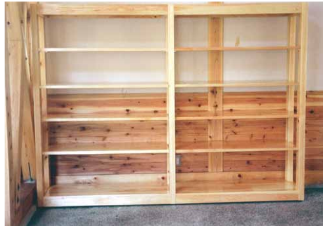
B-9 陳列棚 L2400×W450×H1800 杉・ウレタンニス塗布 (道の駅・君津市)