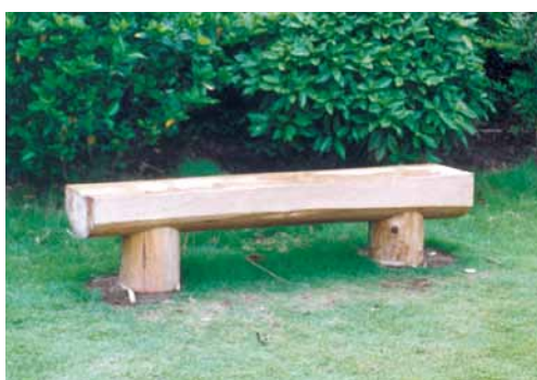
A-22 丸太ベンチ L1800×W300×H400 杉・NZN防腐注入 (親水公園・我孫子市)