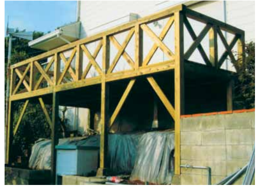
A-10 ウッドデッキ L6100×W2760 杉・タナリスCY・表面保護塗料塗布 (別荘地・君津市)