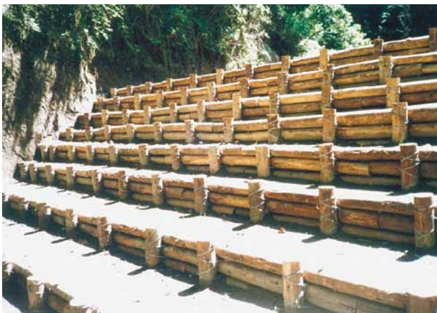
C-7 木製護岸工 杭木1500×100 横木3000×100 (県民の森・君津市)