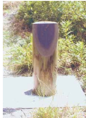
A-63 車留め H700×φ250 杉・タナリス防腐注入