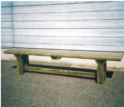
A-13 ベンチ L1800×W300×H390 杉・タナリス防腐注入・表面保護塗料塗布 (老人福祉センター・南房総市)