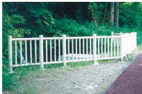
A-1 木製安全柵 L1500×H1300 (1スパン) 杉・ペンタキュアニュー BM防腐注入 (洞庭湖・一の宮町)