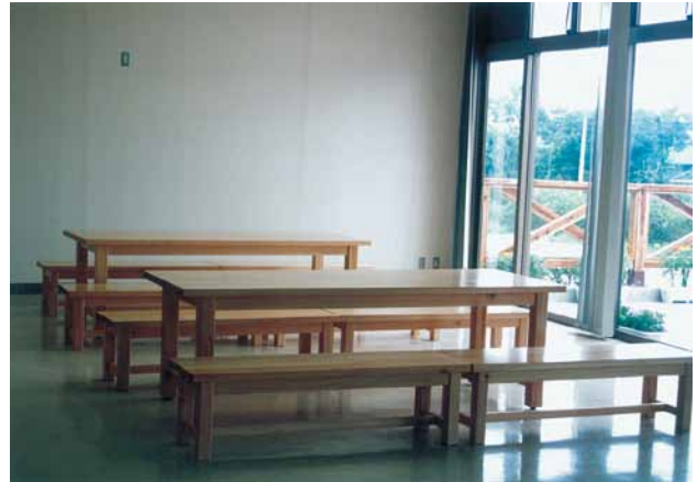
B-13 テーブル L2400×W800×H700 桧・ウレタンニス塗布 B-14 ベンチ L1400×W400×H400 桧・ウレタンニス塗布 (野鳥の森・館山市)