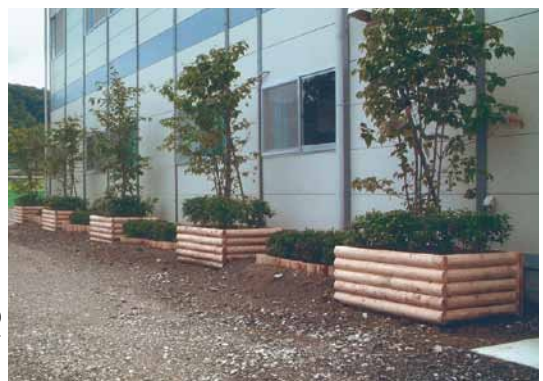
A-37 木製プランター L1200×W800×H500 杉・塗装仕上げ (工事事務所・君津市)