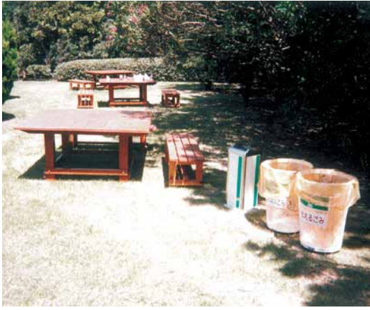
A-28 テーブル L1500×W1500×H750 杉・塗装仕上げ A-29 ベンチ L1500×W400×H400 杉・塗装仕上げ (全国都市緑化フェア・千葉市幕張メッセ)