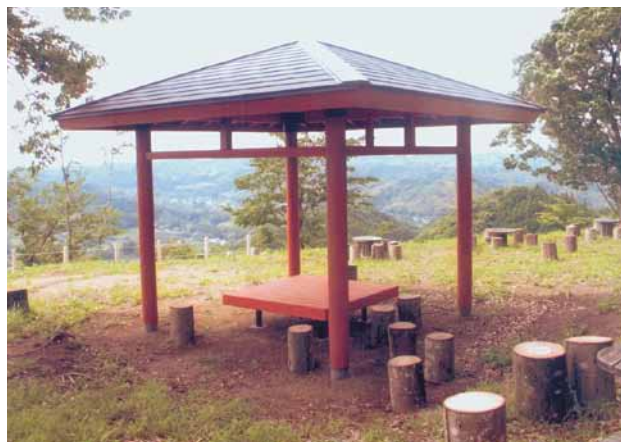
A-56 四季東屋 W2700×H2700 杉・ペンタキュアニュー BM防腐注入 (万葉の道・大多喜町)