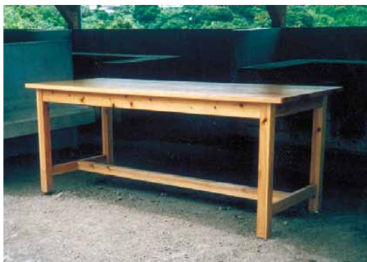
A-23 調理台 L1800×W900×H900 桧・ウレタンニス塗布 (体験施設・鴨川市)