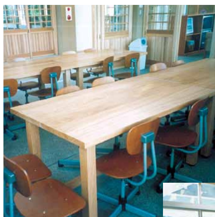
B-5 工作台 L1500×W900×H700 タモ集成材 ウレタンニス塗布 (コミュニティーセンター・ 君津市)