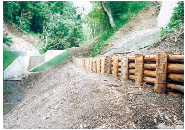
C-6 土留工 杭木4000×120 横木3000×100 (富山町山田)