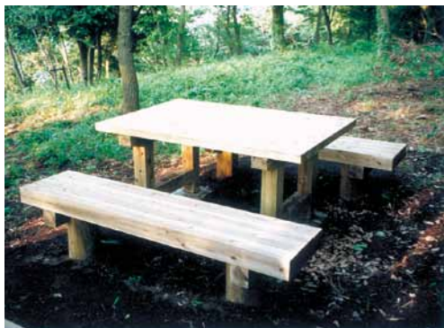
A-16 テーブル L1400×W1004×H750 杉・タナリス防腐注入 A-17 ベンチ L1400×W300×H400 杉・タナリス防腐注入 (三舟山・君津市)