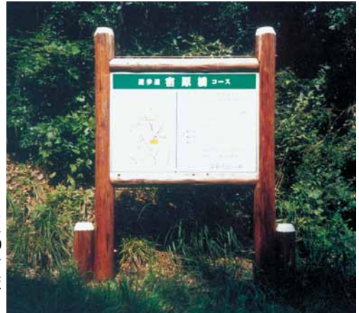
A-49 案内看板 H2700×L1900 杉・防腐塗着色料塗布 表示板アルミ複合板 (県民の森・君津市)