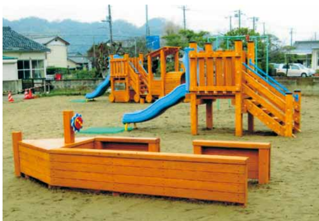
A-57 木製遊具 杉・ペンタキュアECO30・表面保護塗料 (保育所・鋸南町)