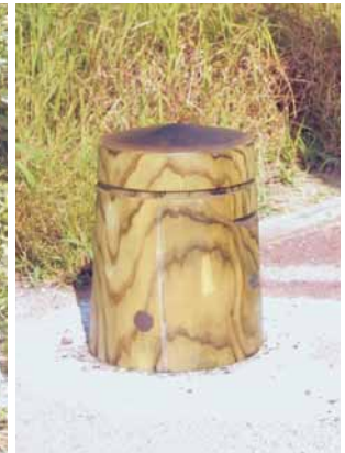
A-64 車留め H450×φ350 杉・タナリス防腐注入 (遊歩道・富津市)