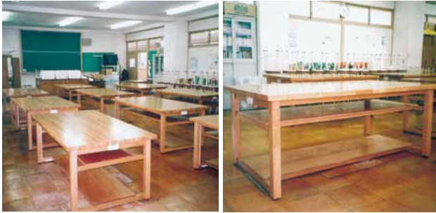
B-6 工作台 L1800×W1000×H750 ナラ・ウレタンニス塗布 (高等学校・君津市)