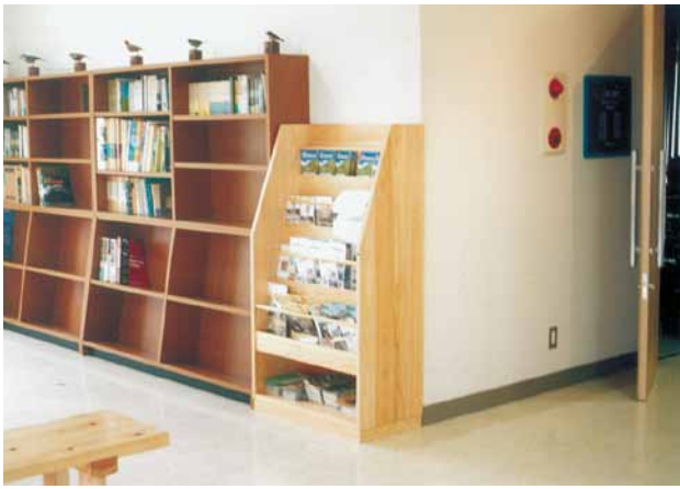
B-12 木製ラック H1420×W800 桧・ウレタンニス塗布 (野鳥の森・館山市)