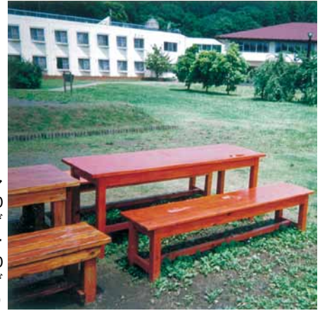
A-30 テーブル L2000×W900×H750 杉・塗装仕上げ A-31 ベンチ L2000×W450×H450 杉・塗装仕上げ (少年自然の家・君津市)