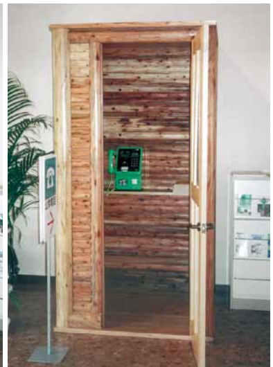
B-17 木製電話ボックス 杉・ウレタンニス塗り (県民の森・鴨川市小湊)