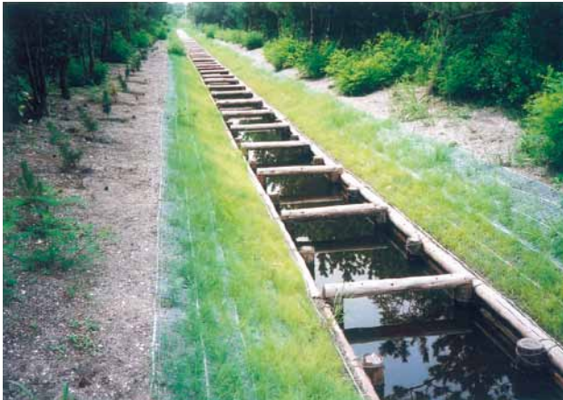
C-12 木製水路工 杭木3000×120 横木3000×100 (富津岬・富津市)