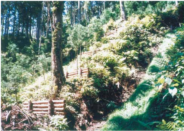
C-2 丸太柵工 杭木2000×120 横木3000×100 (県民の森・君津市)