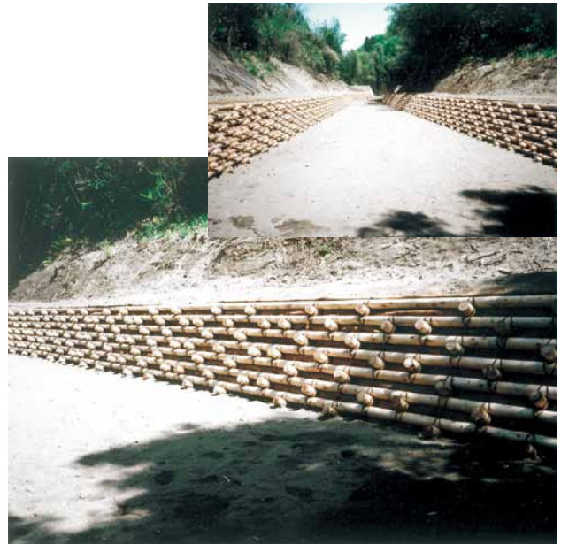
C-13 流路工 杉・杭木1.0m×φ10cm 杉・杭木3.0m×φ10cm 杉・横木2.0m×φ10cm 杉・控木1.0m×φ10cm (君津市・鎌滝)