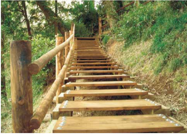
C-11 木道 杉・米杉・タナリスCY防腐注入 (市民公園・香取市)