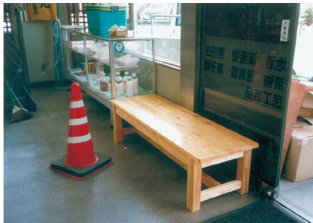
B-2 ベンチ L1500×W450×H350 桧・ウレタンニス塗布 (物産館・千葉市)