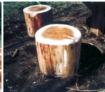
A-21 スツール H500×φ400 杉・ペンタキュアニュー BM防腐注入 表面保護塗料塗布 (三舟山・君津市)