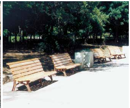
A-15 桧ベンチ上板 L = 1800 桧・NZN防腐注入・ウレタンニス塗布 (市民公園・富津市)