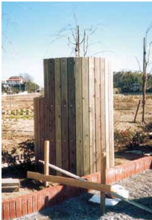
A-62 方向指示板 H1950×径1380 杉・タナリス防腐注入 (ポケットパーク・市原市)