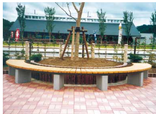
A-18 半円サークルベンチ 径4000×H590 杉・NZN防腐注入 塗装仕上げ (道の駅・君津市)