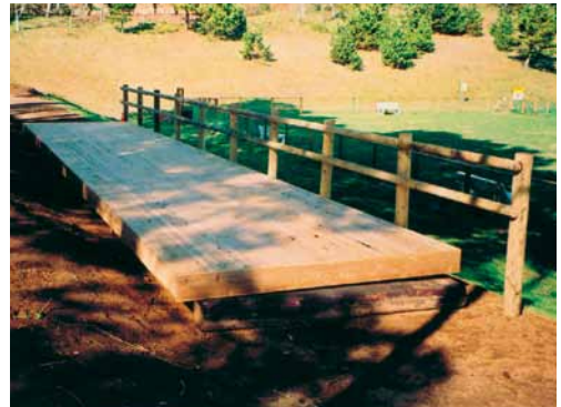
A-12 ウッドデッキ・フェンス L13500×W2000 杉・タナリスCY防腐注入 (テーマパーク内・富津市)