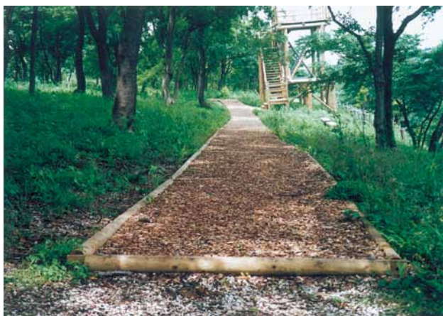
A-55 丸太縁石 杉・円柱加工材タナリスCY防腐注入 (三舟山・君津市)