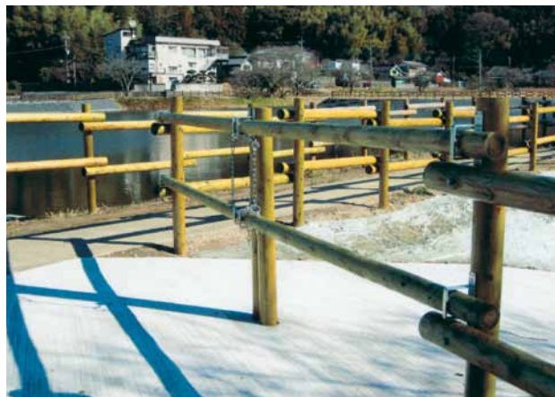
A-5 木製門 支柱H2000×φ100 横木H2000×φ100 ACQ防腐注入・表面保護塗料塗布 (留池・君津市)