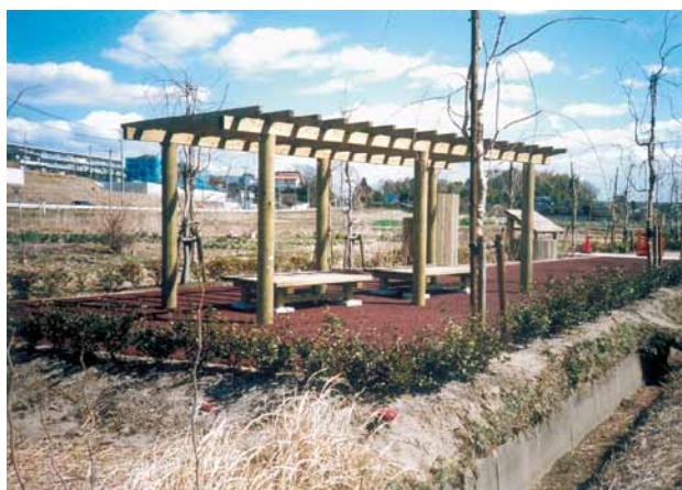
A-59 パーゴラ L7000×W3000×H2500 A-60 ベンチ L1800×W1200×H350 桧・タナリス防腐注入 表面保護塗料塗布 (ポケットパーク・市原市)