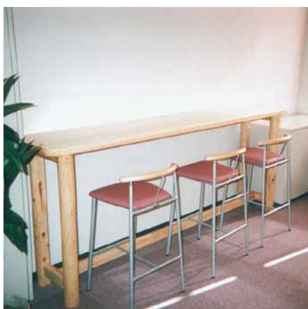
B-4 桧休憩テーブル L2300×H950×W450 桧・ウレタンニス塗布 (千葉県庁・千葉市)