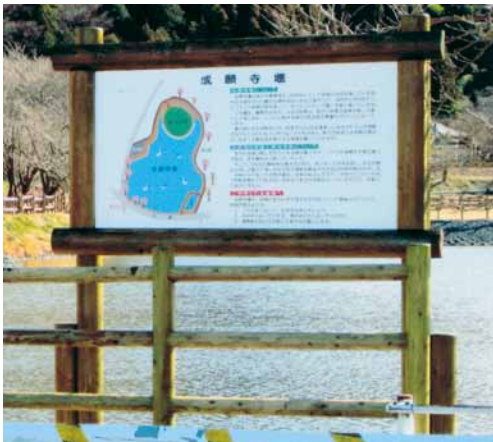
A-52 木製案内看板 H2500×W1800 杉・ACQ防腐注入・表面保護塗料 (ため池・君津市)