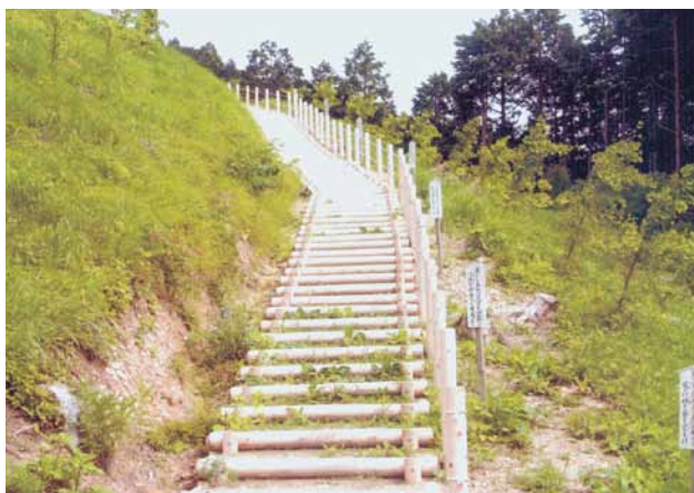
A-6 木製階段 W1000 杉・ペンタキュアニュー BM