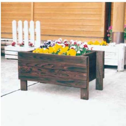
A-36 木製プランター L900×W480×H480 杉・焼磨き (千葉市各所)