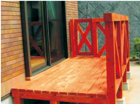
A-11 ウッドデッキ・フェンス L2000×W1500 杉・塗装仕上 (一般住宅・千葉市)