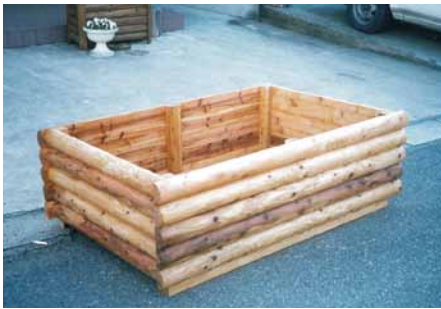
A-34 ウッドプランター L1540×W1000×H500 杉・塗装仕上げ (老人福祉センター・南房総市)