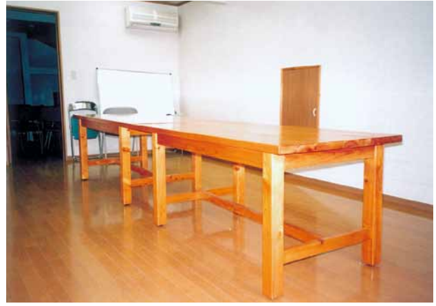
B-7 会議用テーブル L1700×W750×H700 桧・ウレタンニス塗布 (当社・富津市)