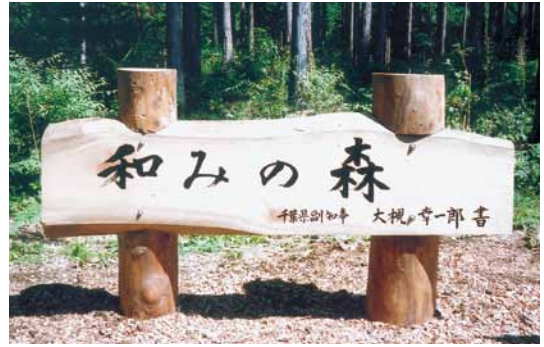
A-41 木製看板 L2400×H1300 楠・塗装仕上げ (県民の森・君津市)