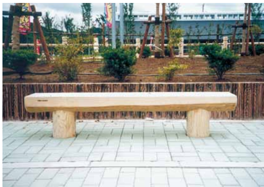
A-26 丸太ベンチ L1800×W300×H400 杉・NZN防腐注入材 塗装仕上げ (道の駅・君津市)