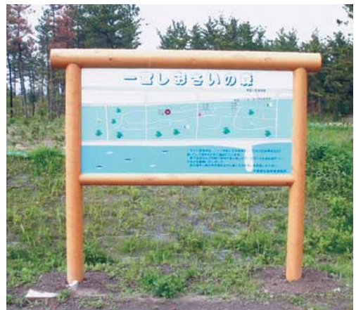
A-53 案内看板 H2180×W2500 桧・ペンタキュアニュー BM防腐注入 表面保護塗料塗布 (しおさいの森・一宮)