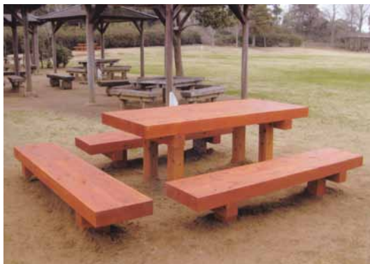
A-19 木製テーブル・ベンチ テーブルL1900×W800×H700 ベンチL1900×W400×H400 杉・タナリス防腐注入・表面保護塗料塗布 (市民の森・東庄町)