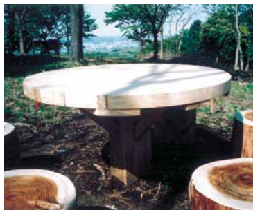
A-20 円形テーブル H700×φ1200 杉・ペンタキュアニュー BM防腐注入 表面保護塗料塗布