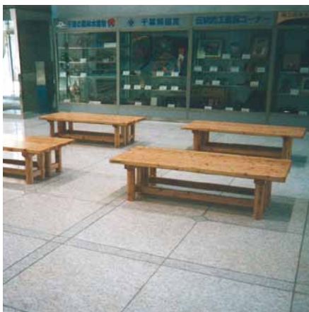
B-3 桧半割丸太ベンチ L1800×H450×W400 桧・ウレタンニス塗布 (千葉県庁・千葉市)