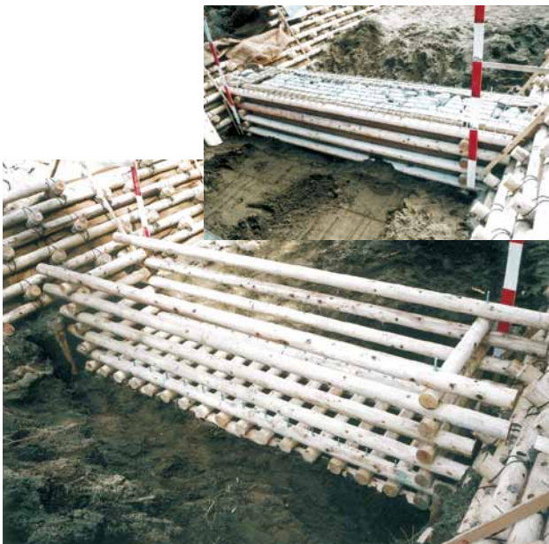
C-14 木製帯工 杉・横木4.0m×φ10cm 杉・横木1.0m×φ10cm (君津市・鎌滝)