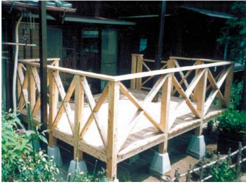
A-9 ウッドデッキ L3400×W2500×H500 桧・ペンタキュアニュー BM防腐注入