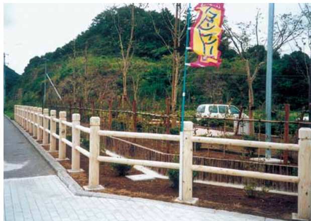
A-4 木製フェンス H = 1100 杉・NZN防腐注入材 (道の駅・君津市)