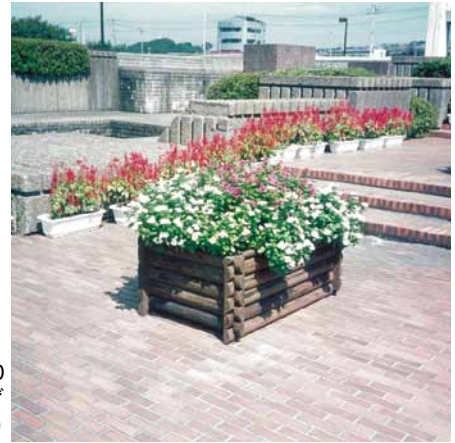
A-33 ウッドプランター L1200×W800×H400 杉・塗装仕上げ (県内各所)