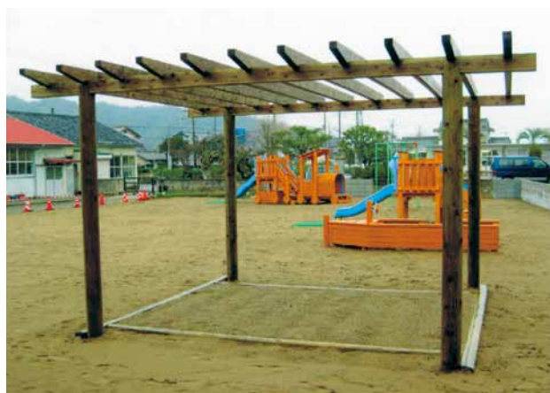
A-58 パーゴラ砂場 L4400×W4000×H2500 杉・タナリスCY・表面保護塗料塗布 (保育園・鋸南町)