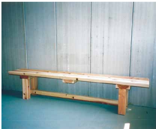
B-1 ベンチ L1800×W300×H390 杉・超仕上げ (高等学校・木更津市)