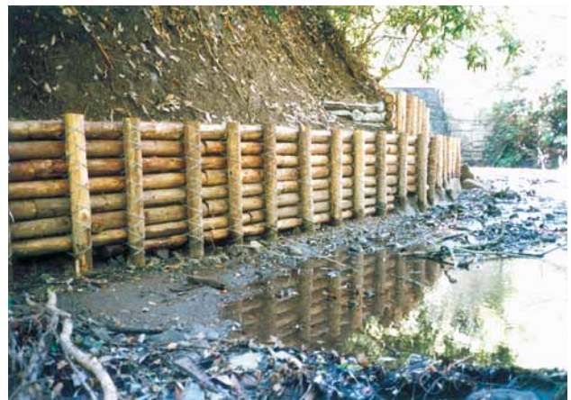
C-8 木製護岸工 杭木3000×120 横木4000×120 (県民の森・君津市)