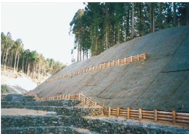
C-10 丸太柵工 杭木1500×100 横木2000×100円柱加工 (君津市草牛)