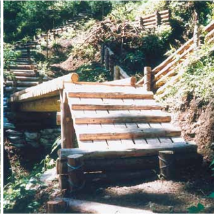
C-1 木橋 L4000×W1500 (県民の森・君津市)