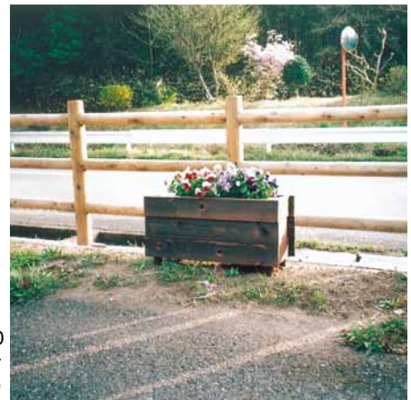
A-35 木製プランター L760×W520×H380 杉・焼磨き (当社・富津市)