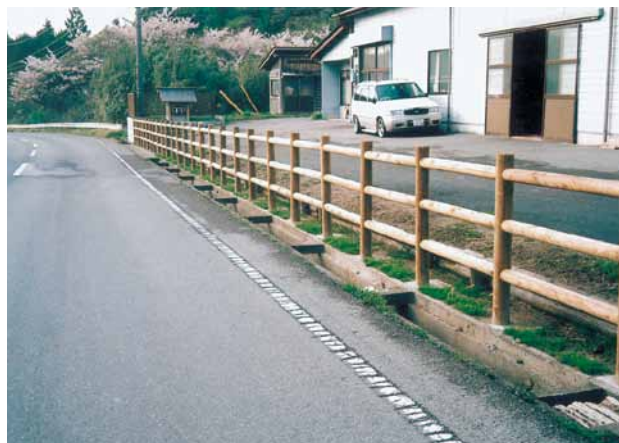
A-8 木製防護柵 L1500×H1200 (1スパン) 杉・タナリスCY防腐注入 (当社・富津市)