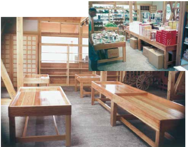
B-8 陳列台 L1700×W900×H650 杉・ウレタンニス塗布 (道の駅・君津市)