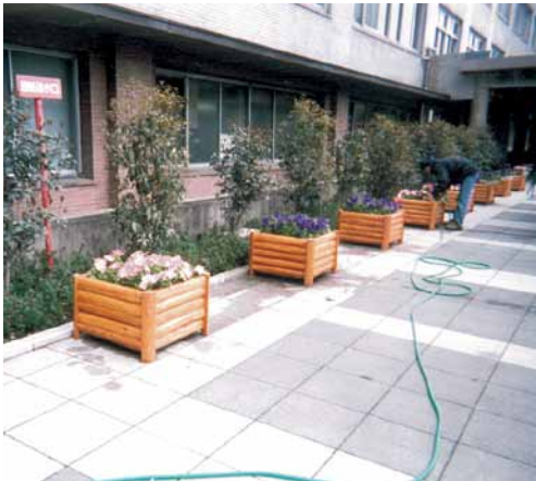
A-32 ウッドプランター L690×W690×H460 杉・塗装仕上げ (官庁・東京都霞ヶ関)