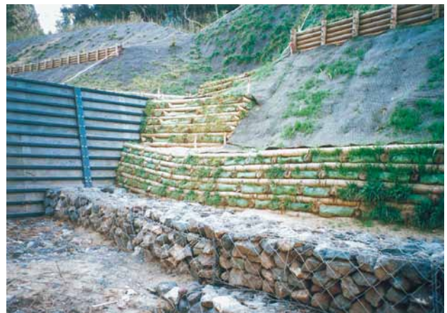
C-9 丸太柵土留工 横木2000×100円柱加工 控木600×100円柱加工 (君津市草牛)