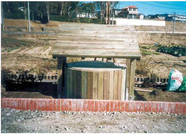
A-61 案内看板 H1630×H1700 杉・タナリス防腐注入 表面保護塗料塗布 (ポケットパーク・市原市)