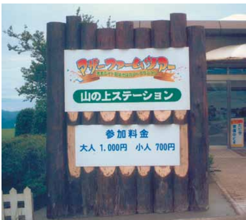
A-54 モニュメントサイン W2500×H3000 杉・塗装仕上げ (テーマパーク・富津市)