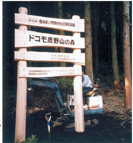
A-51 案内看板 H1200×L1800 塗装仕上げ (鹿野山・君津市)