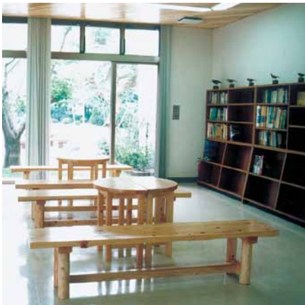
B-15 テーブル H700×径600 B-16 ベンチ L1800×W400×H400 桧・ウレタンニス塗布 (野鳥の森・館山市)