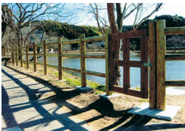
A-2 木製扉 支柱 W900×H1000 ACQ防腐注入・表面保護塗料塗布