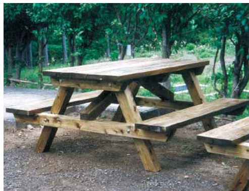
A-27 野外卓 L1540×W1800×H750 桧・タナリス注入・ウレタンニス塗布 (県民の森キャンプ場・君津市)