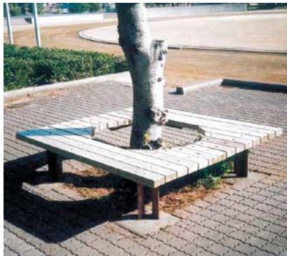
A-14 サークルベンチ L1600×W1530×H350 桧・タナリス防腐注入 (市民公園・富津市)