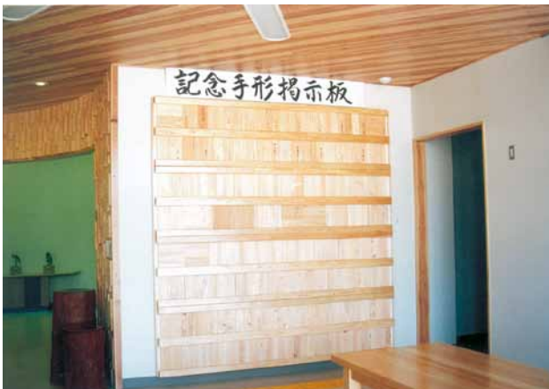
B-10 壁パネル H2620×W2520 マテバシイ・ウレタンニス塗布 (野鳥の森・館山市)