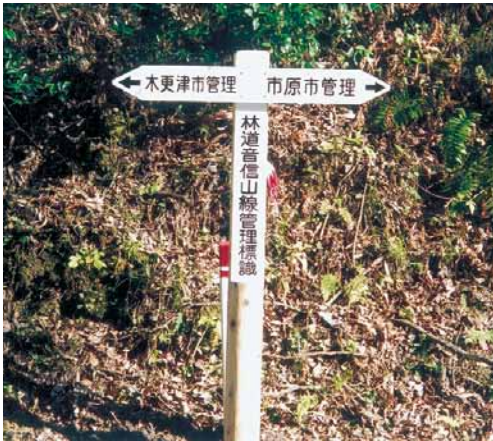
A-50 管理標識 H1500×L920 杉・円柱加工材 塗装仕上げ (養老線・木更津市)