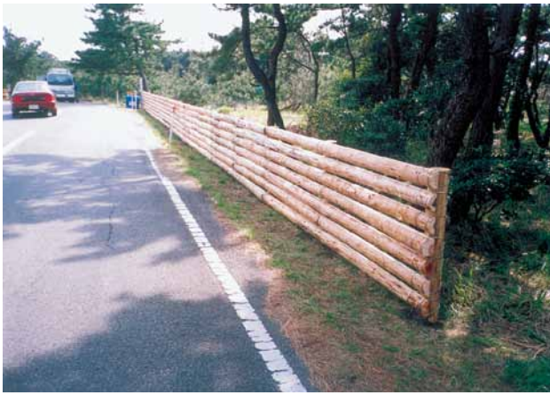
C-5 防風柵工 杭木2000×120 横木4000×100太鼓半割 (富津岬・富津市)